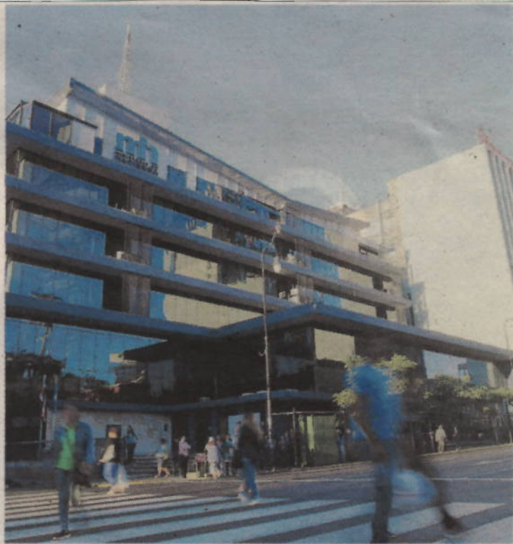
El Ministerio de Hacienda se negó, desde el 2016, a elevar la contribución estatal al régimen de Invalidez, Vejez y Muerte. RAFAEL PACHECO