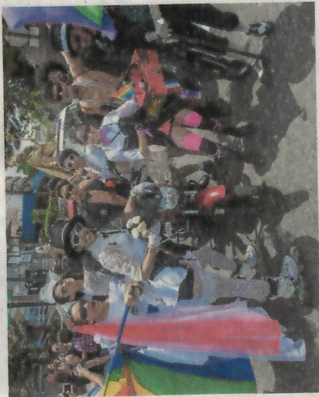
El orden y el respeto reinarán en la Marcha de la Diversidad 2016.