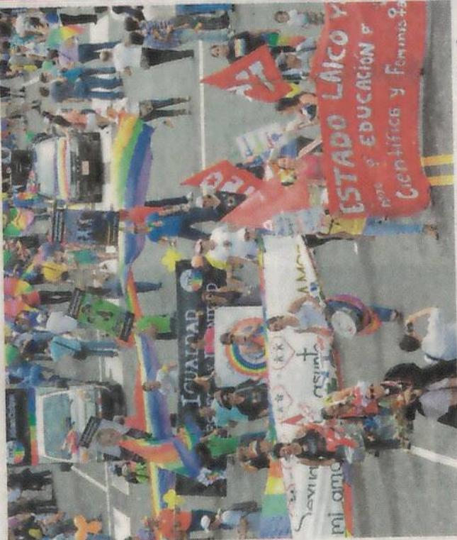
Se esperan más de 20.000 personas desfilando entre el paseo Colón y la avenida Segunda de San José.