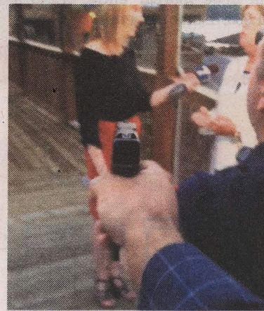
La escena es de una película de terror.

"Envías a gente a zonas de guerra y a situaciones peligrosas, a re-