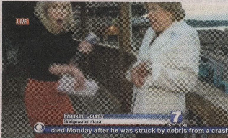
¡Horror! La periodista Parker a punto de recibir los mortales balazos. La entrevistada quedó gravemente herida.