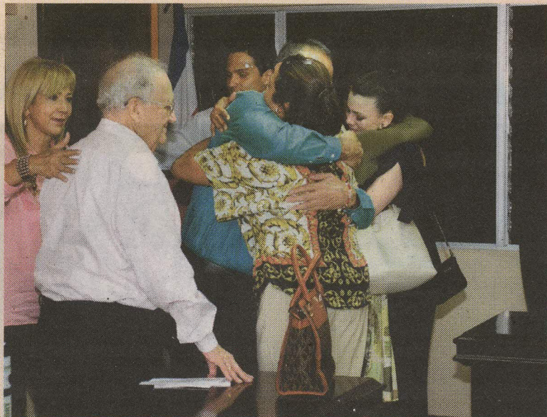
Familiares de Solano lo envuelven en un abrazo al final del juicio. CARLOS GONZÁLEZ