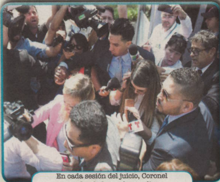
En cada sesión del juicio, Coronel era abordada por los medios.

Para esta familia lo peor que le pudo haber pasado a este padre y esposo fue haber sido detenido, trasladado y juzgado en territorio es-