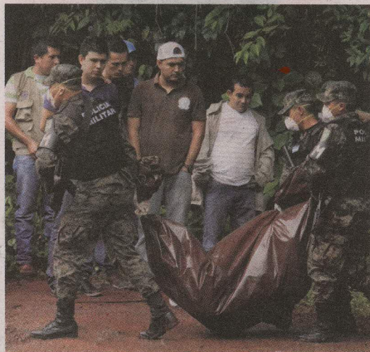
Los cuerpos de las hermanas los encontraron el miércoles pasado.

Los organizadores del certamen harán un servicio especial el domingo con todas sus participantes para honrar a las jóvenes.