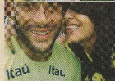
La pareja tenía planeado casarse.