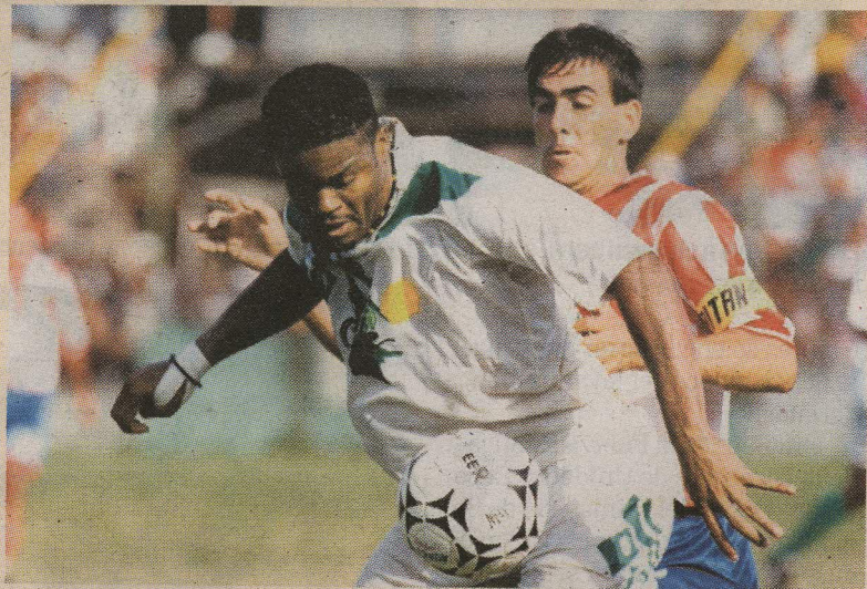
Una vez, el delantero se puso un brassier para celebrar un gol.

De acuerdo con la oficina de prensa de la Fiscalía, el 22 de marzo anterior el exdelantero aparentemente llegó a la casa donde vive la jovencita y le habría dado va-