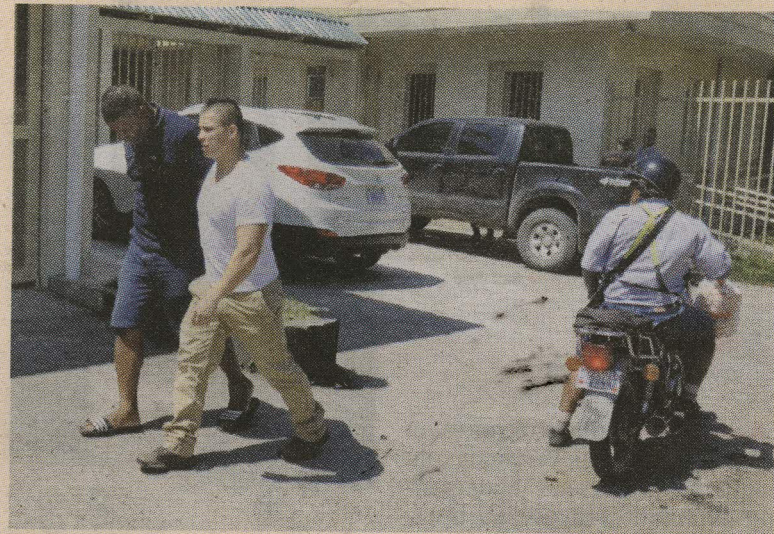
Douglas se entregó ayer en la mañana en el OIJ de Bribri. RONY JAÉN

formó que Douglas se entregó ayer en la mañana en el OIJ de Bribri.