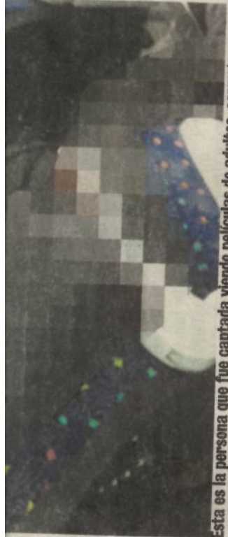
Esta es la persona que fue captada viendo películas de adultos.

Según las estadísticas del sitio más grande del mundo en pornografía, Pornhub, Costa Rica ocupa el puesto 69 en el tráfico en este sitio web, así salió en una medición del 2017, un puesto alto tomando en cuenta que a nivel de población ocupamos el puesto 122.