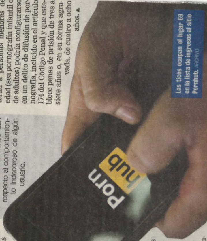
Los ticos ocupan el lugar 69 en la lista de ingresos al sitio Pornhub.

Si la persona muestra ese material a personas menores de edad (sea pornografía infantil o de adultos) podría configurarse en un delito de difusión de pornografía, incluido en el artículo 174 del Código Penal y que establece penas de prisión de tres a siete años o, en su forma agravada, de cuatro a ocho años. ▲