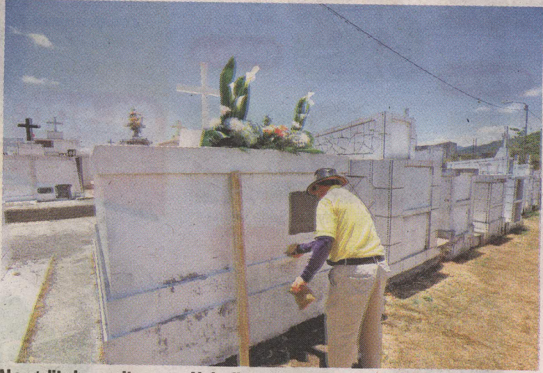
Al angelito lo sepultaron en Alajuelita el domingo en la mañana. JOSÉ RIVERA.

“Por protocolo a la mujer se le atendió en el mismo centro penitenciario y luego la llevaron al CAIS de Desamparados para que fuera valorada por los médicos”, agregó Villalobos.