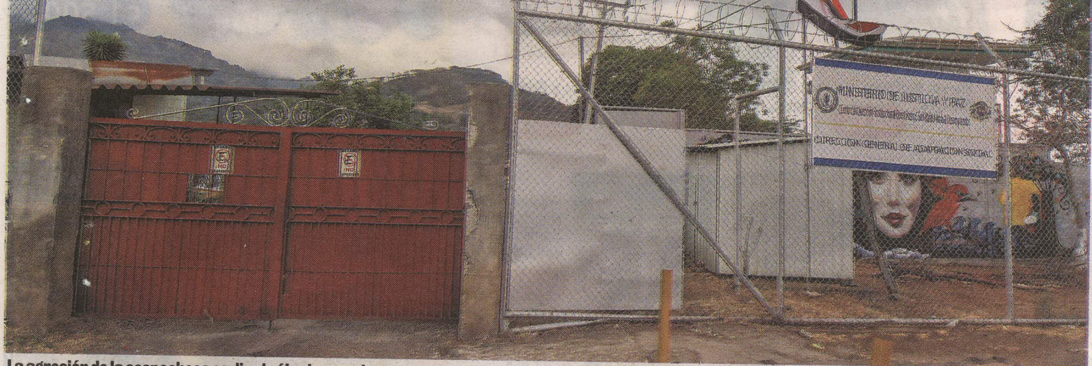
La agresión de la sospechosa se dio el sábado pasado. JEFFREY ZAMORA.