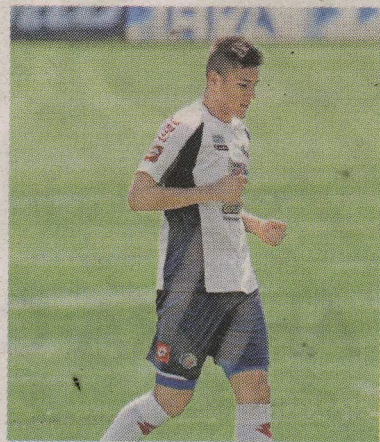
La afectada es hermana de la esposa del seleccionado.

Las autoridades judiciales presumen que el ataque que sufrió ayer la mujer está relacionado con algún problema por drogas.