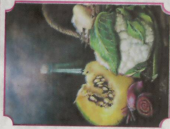
"Bodegón de hortalizas"