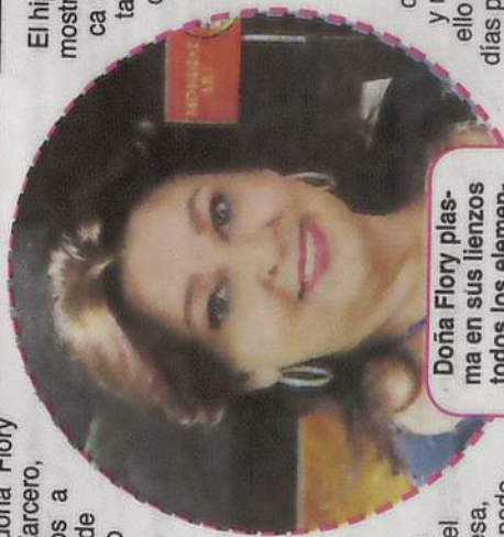
Doña Flory plasma en sus lienzos todos los elementos naturales.

Si desea conocer más acerca de los cuadros y trabajos realizados por esta artista zarcerena, puede ponerse en contacto con ella a través del número telefónico 8867-6061.