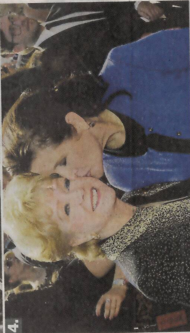
4. De malde entretuvo a los soldados norteamericanos en Seúl, en 1955. 2. La actriz fue