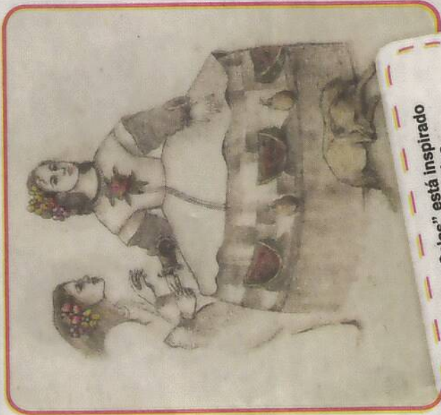
"Infantas Salas" está inspirado en su hija y sobrina.