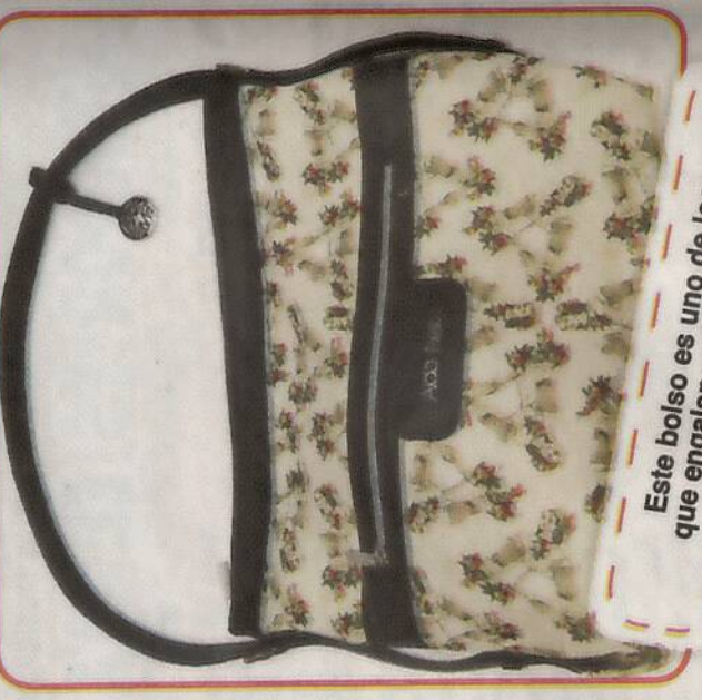
Este bolso es uno de los que engalanan la colección.