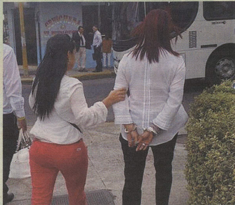
La abogada fue detenida cuando entregaba la plata.

La Teja intentó comunicarse con Bedoya pero fue imposible localizarla.