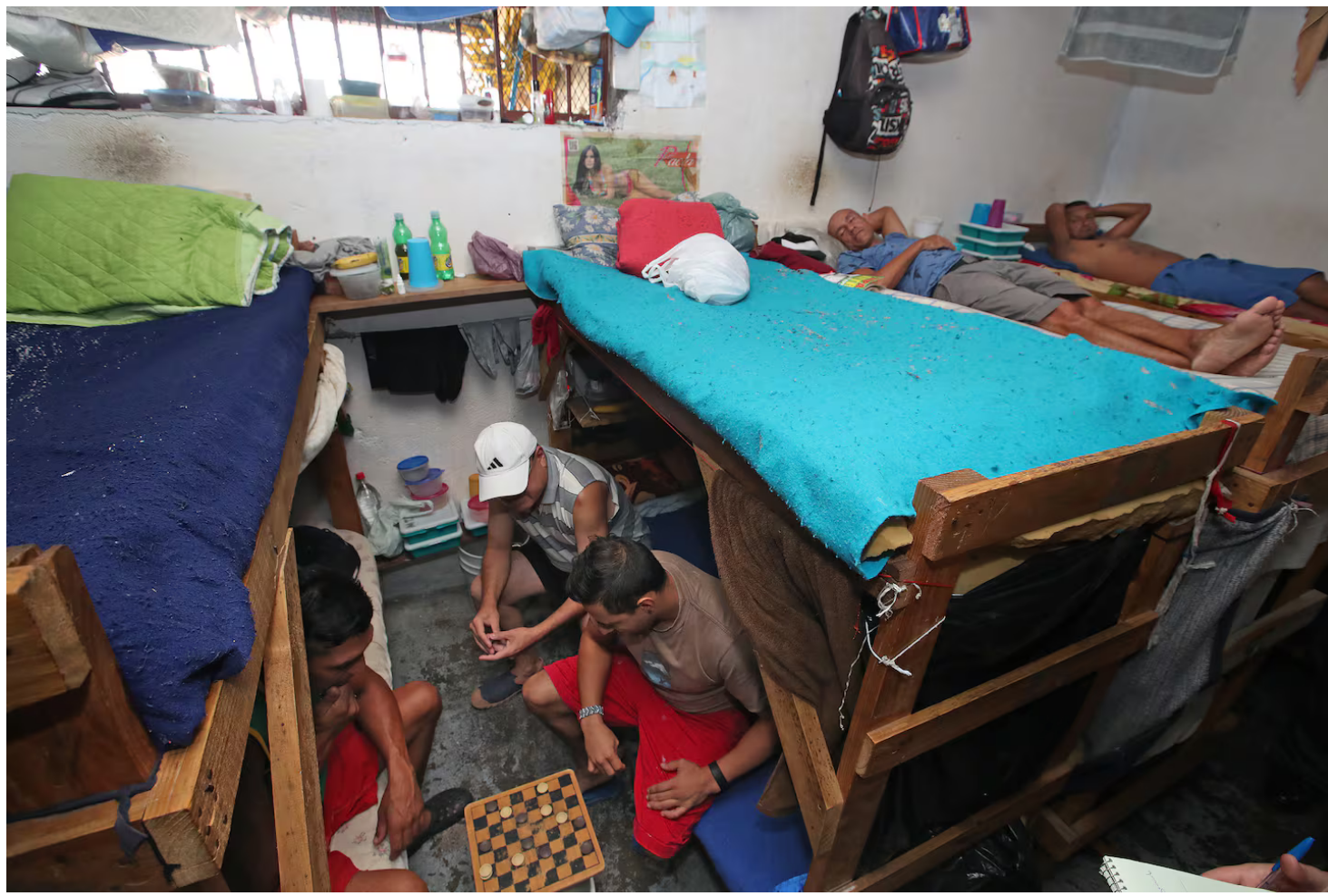
El INC es el que se encarga de analizar y de, eventualmente, otorgar beneficios a reos que quieren pasar de una cárcel al sistema semiliberto.